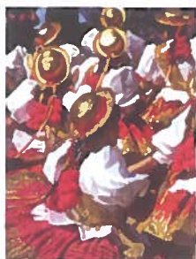
Portada: La Tirana